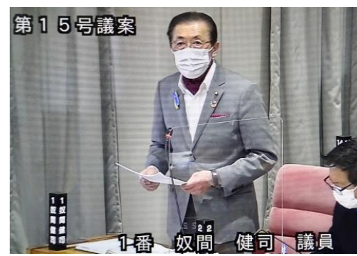
3月23日の本会議で予算案に賛成討論執行上の留意点を指摘(3ページ参照)

古賀市議会は、ロシアによるウクライナ侵攻に抗議する決議を賛成全員で可決しました(3月23日)