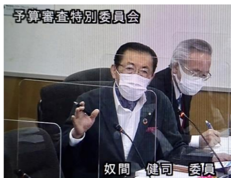
5日間の予算審査特別委員会で詳細質疑薬王寺快生館について市長質疑を行いました

古賀市の予算や財政についてご質問、ご意見がありましたらメールを送ってください。私の見解を添えてご説明いたします。メールの送り先: ny2knm@gmail.com