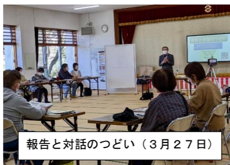
報告と対話のつどい (3月27日)